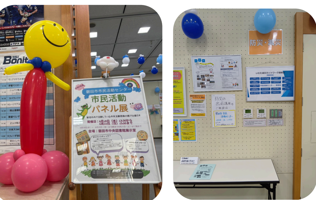
▲会場全体をバルーン装飾