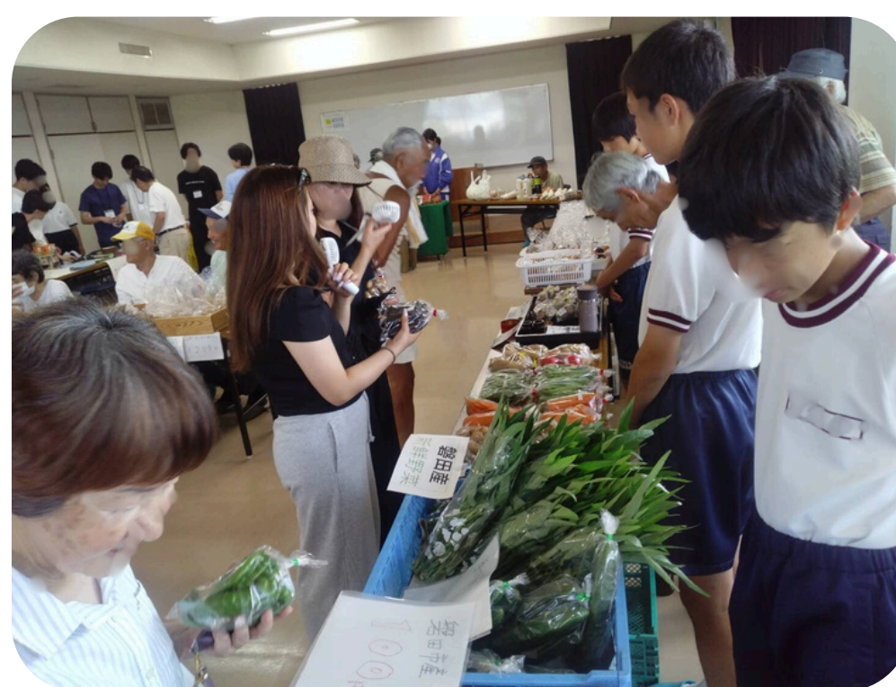
▲浜小屋で販売のお手伝いをする